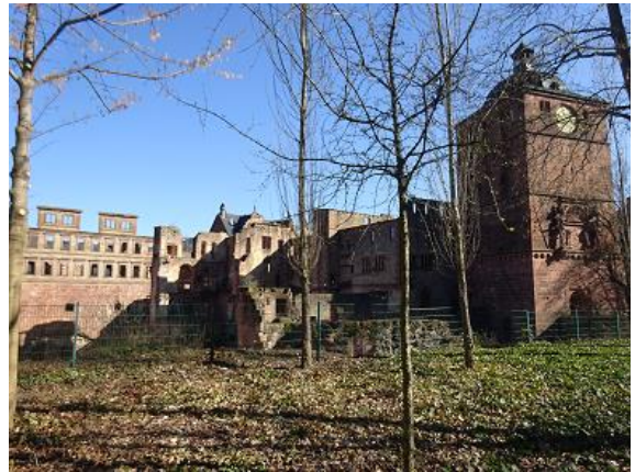
Das Heidelberger Schloß

Das römische Heidelberg bestand vom 1. bis zum 3. Jahrhundert n. Chr. Um 70 n. Chr. gründeten die Römer ein Lager im heutigen Neuenheim, das um 90 durch zwei steinerne Kastelle ersetzt wurde. Über den Neckar führte zunächst eine hölzerne Brücke, ab circa 200 eine Steinpfeilerbrücke. Auf dem Gipfel des Heiligenbergs entstand ein Merkurtempel, auch der Mithras-Kult war in Heidelberg verbreitet. Der Hauptort der Region war in römischer Zeit das benachbarte Lopodunum (heute Ladenburg), aber auch um das Militärlager in Heidelberg (dessen lateinischer Name unbekannt ist) entwickelte sich ein florierendes Töpfereizentrum. Nach 260 mussten sich die Römer vor dem Germanenstamm der Alemannen, der den Limes durchbrochen hatte und in römisches Territorium eingefallen war, an den Rhein zurückziehen. Der Sieg des Merowingerkönigs Chlodwig I. über die Alemannen im Jahr 506 machte Heidelberg schließlich zu einem Teil des Frankenreichs, zugleich wurde das Gebiet christianisiert.