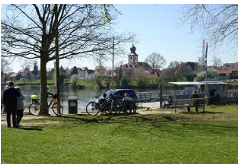
Die Fähre nach Neckarhausen

ÖPNV: Durch das Ortsgebiet führt die Stadtbahnlinie 5 mit direkten Verbindungen in die Innenstädte von Mannheim und Heidelberg.