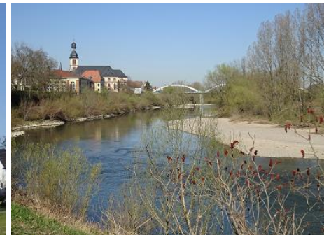
Das Naturschutzgebiet Neckarhalden