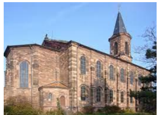
Die Dreifaltigkeitskirche Sandhofen

ÖPNV: Sandhofen ist mit der Straßenbahnlinie 3 des RNV angebunden. Übersichtskarte: „© OpenStreetMap Mitwirkende“, Text und Bilder: Odenwaldklub e.V.