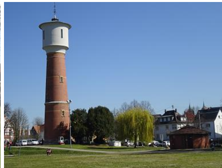
Der Wasserturm im Benzpark