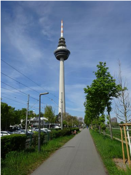
Fernsehturm am Luisenpark

Wir starten die zweite Etappe an der Neckarbrücke zwischen Ilvesheim und Seckenheim und wandern gemütlich immer in Sichtweite unseres Flusses entlang. Wir kommen dem markanten Fernsehturm immer näher und der vielbefahrene Asphaltweg führt uns an den Gleisen der Straßenbahn und an Hecken und Bäumen vorbei nach Neuostheim. Wer möchte kann auf einen Gras- oder Schotterweg in den Neckarauen entlang laufen, aber nach dem Fernsehturm sollten wir uns wieder zur Markierung begeben. Als Nächstes erreichen wir den Luisenpark mit seinen vielen Freizeiteinrichtungen.