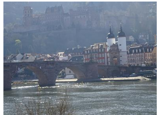
Die Alte Brücke