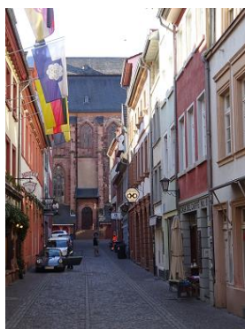
Die historische Altstadt