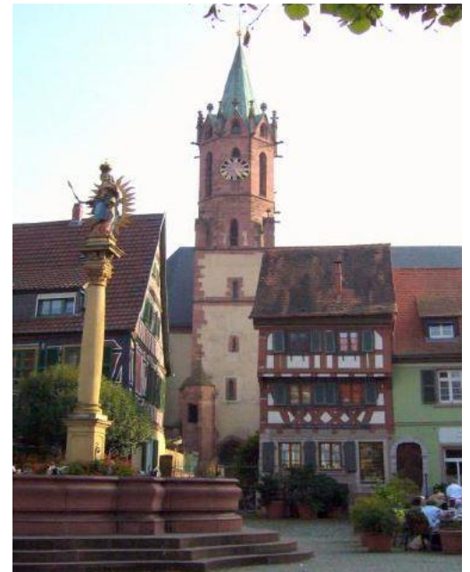
Der historische Marktplatz von Ladenburg

ÖPNV: Durch das Ortsgebiet führt die Stadtbahnlinie 5 mit direkten Verbindungen in die Innenstädte von Mannheim und Heidelberg.