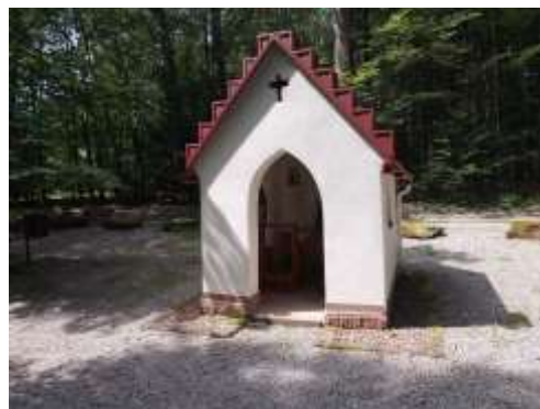
Die kleine Kapelle auf dem Beuchener Berg

Unsere Markierung führt uns auf der Höhe bis nach Steinbach, das zu Mudau gehört. Steinbach stand in früherer Zeit lange