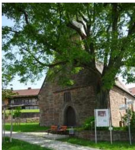
St. Martins- und Veitkapelle von Steinbach