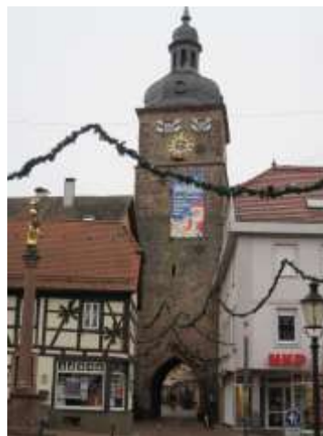
Stadttor von Buchen

ÖPNV: In Buchen am Bahnhof hat man Anschluß an die Madonnenlandbahn nach Miltenberg und Seckach.