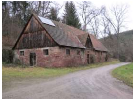
Das verlassende Dorf Galmbach

deshalb wird der Ort auch Schlangennest genannt. Auf der Mudauer Hochebene angekommen, wandern wir auf Forstwegen nach Waldauerbach, weiter durch den kleinen Ort und durch den Wald nach Langenelz. Dann geht es ein kurzes Stück nach Norden auf der Wanderbahn nach Mudau. Das Rathaus, ein spätgotischer Bau wurde 1434 von dem Erzbischof Dietrich, Schenk zu Erbach und dem Kurfürsten von Mainz geschaffen.