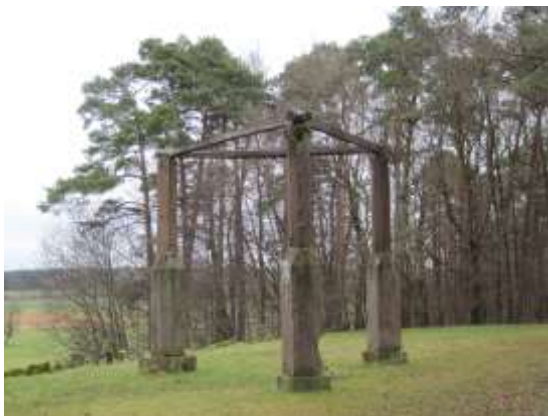
Der Galgen bei Mudau

Am Anfang der Etappe kommen wir zum ehemaligen Galgen der Blutgerichtsbarkeit des Markt Mudau. Auf der Hochebene wandern wir leicht abwärts nach Hollerbach und gehen am idyllischen Hollersee mit Rastplatz vorbei. Auf einem Pfad erreichen wir das Wanderheim des OWK Buchen und befinden uns nach wenigen Minuten am Ende des Bergstraße-Madonnenländchen-Weges in der Ortsmitte von Buchen. Buchen wurde erstmals 773 genannt und besitzt einen historischen Stadtkern mit zahlreichen Fachwerkbauten. Um 1170 erstmals im Besitz der Herren von Dürn, die den Ort zur Stadt erhoben. 1309 an den Mainzer Erzbischof verkauft und wegen Beteiligung am Bauernaufstand 1525 verlor die Stadt ihre Selbstverwaltung. 1717 wurde ein Großteil der Stadt durch ein Großfeuer vernichtet.