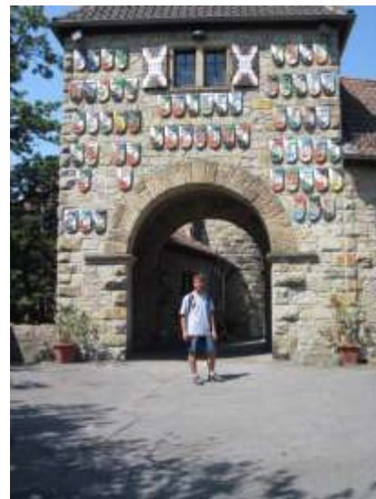
Das Tor zur Wachenburg

ÖPNV: Täglich verkehren Linienbusse nach Weinheim und Grasellenbach.