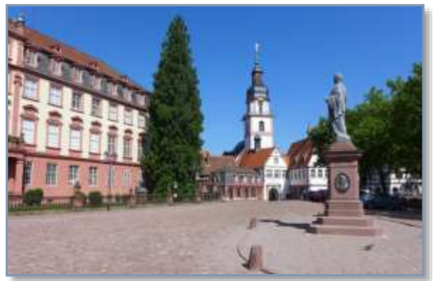
Das Erbacher Schloß

kleines Stück an der Mümling entlang nach Lauerbach und erreichen über die Feldflur und einem Anstieg die kleinen Erbacher Ortsteile Günterfürst und Haisterbach. Anschließend gehen wir wieder hinab ins Mümlingtal nach Ebersberg, überqueren den Fluß und erreichen das sehenswerte Himbächel-Viadukt. Das Himbächel-Viadukt ist ein eingleisiges Viadukt der Odenwaldbahn und war eine zeitgenössisch herausragende Ingenieurleistung und die bedeutendste Eisenbahnbrücke in Hessen. Heute ist sie ein Kulturdenkmal aufgrund des Hessischen Denkmalschutzgesetzes. Die 250 Meter lange Bogenbrücke besteht aus zehn Bögen mit je 20 Metern lichter Weite bei einer Maximalhöhe von 43 Meter über der Talsohle. Die Brücke ist in drei Teile gegliedert, den mittleren Teil mit vier Bögen und drei hohen Pfeilern, sowie die beiden Seitenteile mit jeweils drei Bögen. Nun ist es nicht mehr weit bis zum Etappenende am Bahnhof in Hetzbach.