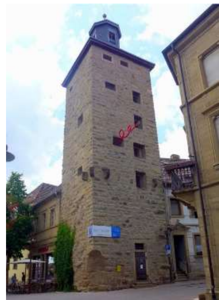
Pfeifferturm von Eppingen

ÖPNV: Die Linie S4 der Kraichgaubahn verkehrt zwischen Karlsruhe–Bretten–Eppingen–Heilbronn. Außerdem ist Eppingen Endhaltepunkt der Linie 5 zwischen Heidelberg und Eppingen.