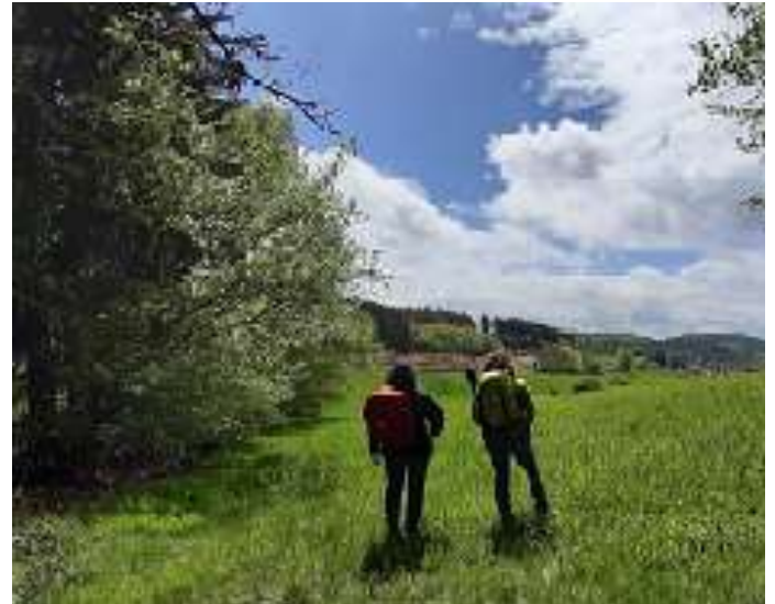
Ausblick ins Sensbachtal