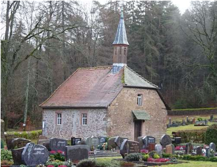
Kirche auf dem Sensbacher Friedhof