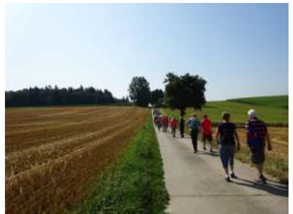
Wandergruppe in Kraichgauer Hügelland

Wir verlassen Neunkirchen und wandern durch landwirtschaftlich genutztes Gebiet in Richtung Aglasterhausen, das wir nach etwa 4 km erreichen. Der etwas seltsame Ortsname stammt vom althochdeutschen agilastra (Elster) ab. In der Ortsmitte befindet sich das Rathaus und die evangelische Kirche. Für die Katholiken wurde 1964 eine stilistisch sehr moderne Kirche erbaut. Wer jetzt Lust hat, kann von hier mit der S-Bahn nach Neckargemünd und weiter nach Heidelberg fahren. Heute ist der Bahnhof Endhaltepunkt, weil man 1945 die Brücke von Obrigheim nach Neckarelz sprengte, die nicht wieder aufgebaut wurde. Wir wandern am Bahnhof vorbei und steigen über rund 50 Höhenmeter über das Dorf, wo der Weg in den Wald führt. Davor hat man einen schönen Blick über Aglasterhausen und den Kleinen Odenwald. Im Vordergrund rechts erkennt man den modernen Kirchturm der katholischen Kirche, und am Horizont etwas rechts dahinter schaut die Kuppe des Katzenbuckels hervor. Nach 500 m entlang des Waldrandes und dann nochmals 300 m durch den Wald trifft man auf den Apothekerpfad. Dort überschreiten wir die Gemarkungsgrenze zu Helmstadt und der Weg führt uns hinaus in die offene Hügellandschaft des Kraichgaus und in die hier Brunnenregion genannte Gegend. Diese wellige fruchtbare Region wird auch die „Toskana Deutschlands“ genannt – u.a. des milden Klimas wegen. (Dieser Titel wird aber auch von der Pfalz, der