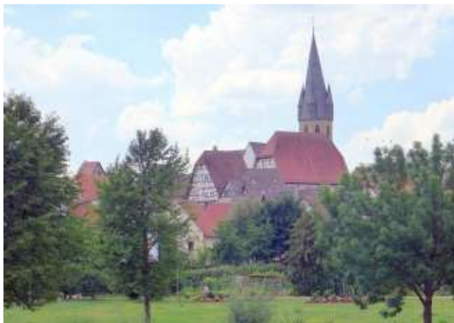
Eppingen vom Wanderweg

Im Jahr 2022 findet eine Gartenschau mit großem Programm statt.