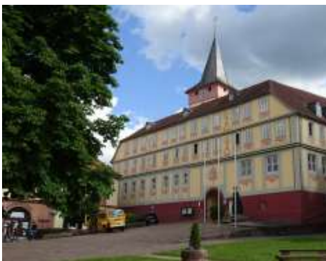
Rathaus Bad König

Wir starten am Bahnhof von Bad König im Mümlingtal. Bad König war bis 1806 Regierungssitz der Grafschaft Erbach-Schönberg mit Schloss. Um 1900 wurden zwei kohlensaure Eisenquellen entdeckt. Später kamen weitere sechs Quellen dazu und Bad König entwickelte sich zu einem bedeutenden „Stahlbad“