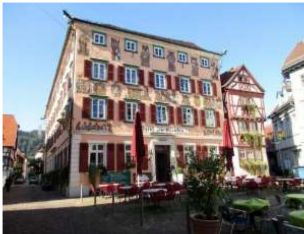
Am Alten Markt in Eberbach

Bistum Worms. Erste urkundliche Erwähnung 1012, um 1227 Stadtrechte, 1330 von Kaiser Ludwig dem Bayern an die Pfalzgrafen verpfändet, war die Stadt bis 1801 kurpfälzisch. 1803 fiel sie an das Fürstentum Leiningen, seit 1806 gehörte die Stadt zu Baden. Reste der Stadtmauer mit Türmen sind noch erhalten. Zunächst lohnt sicherlich ein Rundgang durch die Stadt Eberbach mit seiner attraktiven Innenstadt und seinen schmucken Fachwerkhäusern. Wer sich für Land und Leute mehr interessiert; das Museum des Naturparks Neckartal-Odenwald, vermittelt Wissenswertes zur Region auf vielfältige und sehr interessante Weise.