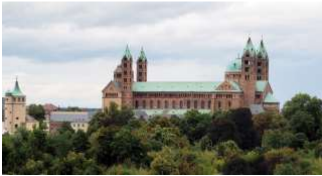
Dom zu Speyer

Die letzte Etappe führt von der Autobahnbrücke über die A6 vorbei an der Rastanlage Hockenheim-West und den Sportanlagen in das über 1250 Jahre alte Hockenheim. Jenseits der Autobahn liegt die traditionsreiche Motorrad- und Formel 1-Rennstrecke Hockenheimring mit seinem Motorsportmuseum. Am Hockenheimer Friedhof biegt der Weg nach Südwesten ab durch die Innenstadt bis zur Kraichbachbrücke,