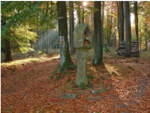
Das Mossauer Bild

Durch abwechslungsreiche Landschaft geht es weiter in Richtung Süden zur Spreng, einer alten Weggabelung auf der Höhe zwischen Mümling- und Gersprenztal. Unsere Markierung führt uns in stetigem Wechsel auf und ab zur Wegspinne „Schlagbaum“. An dieser historischen Stelle befanden sich früher die