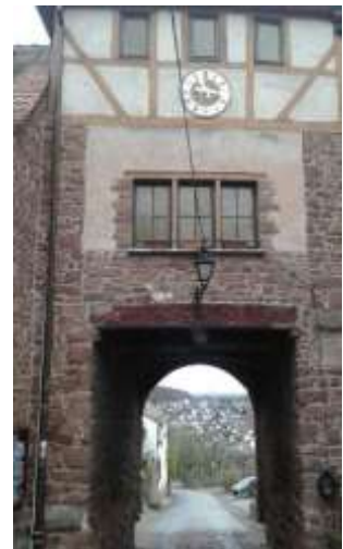
Eingangstor zur Veste Dilsberg

Die hierfür erforderlichen hohen Kosten, hätte ein Gönner, der unbenannt bleiben möchte, übernommen. Die Markierung führt uns steil bergab Richtung Neckar, vorbei an der beschaulichen Lochmühle, bis zur