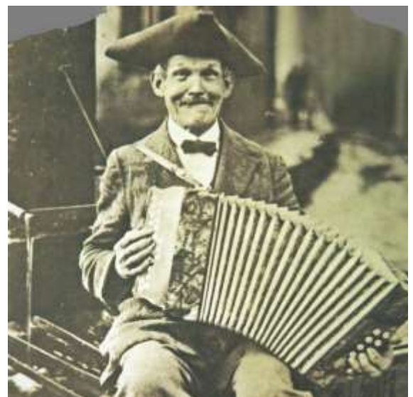
Der Raubacher Jockel

Am Anfang dieser langen Etappe wandern wir das erste Stück parallel zum Qualitätsweg „Nibelungensteig“ bergan zur sagenumwobenen Siegfriedsquelle. Am Wegesrand informieren uns Tafeln über die Nibelungensage. Die Wanderroute führt uns durch den Wald in Richtung Olfen und zum Verbotstein. Der Stein wurde 1831 vom Landratsbezirk Erbach aufgestellt, um die steile Straße hinab nach Olfen vor Beschädigungen zu bewahren. Viele Wagen fuhren neben der befestigten Straße, dadurch wurde das Bremsen erleichtert, aber es entstanden große Spurrillen, die bei Regen die Straße unterspülten und den befestigten Weg schädigten. Anschließend erreichen wir die Affolterbacher Hütte und können hier eine erste Rast einlegen. Auf der Affolterbacher Höhe spazieren wir