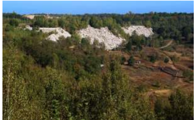
Die Grube Messel

Die Route verläuft weiter über Kalkofen zur kleinen Dianaburg. Die Dianaburg, früher auch Dianenburg, war ein barockes Jagdschloss auf der Gemarkung des heute zu Darmstadt gehörenden Ortes Arheilgen. Es wurde 1765 errichtet und 1808 abgerissen. An ihrer Stelle steht dort heute ein kleiner Pavillon aus dem Jahre 1836, welcher den gleichen Namen trägt. Wir wandern durch den Wald weiter nach Messel zum Bahnhof. Von hier ist es mit einem Abstecher nicht weit zum UNESCO-Weltnaturerbe Grube Messel. Das Seebecken war vor etwa 47 Mill. Jahren ein Maarkratersee und hat heute eine Ausdehnung von 800m Durchmesser und 65m Tiefe. Die Grube Messel ist eine Fossilienlagerstätte und demonstriert eine vitale und explosive Evolution von Säugetieren die im Eozän stattfand ( www.grube-messel.de )