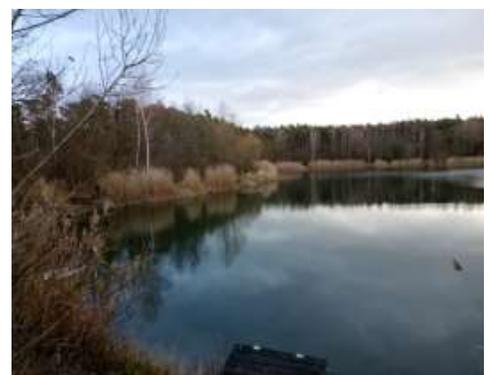
Gänsweidsee in Klein-Gerau

Der Wanderweg beginnt am Bahnhof in Groß-Gerau und führt vorbei an der Großbäckerei Erlenbach in den Groß-Gerauer Stadtwald. Der einzige Anstieg dieser Etappe folgt hier bei der Überquerung der Bahngleise. Am Gänsweidsee in Klein-Gerau geht es nördlich in den Wald und vorbei am Golfplatz Bachgrund. Im Wald kommt dann ein 4,4 km gerades Wegstück und zweigt dann ab zum Steinrodsee. Am Apfelbach entlang führt der Weg weiter nach Wixhausen.