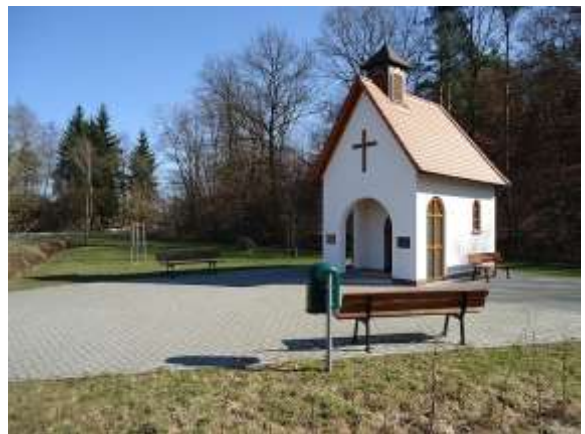
Die St. Anna-Kapelle

Anna-Kapelle besuchen. Sie stand ursprünglich an der Ecke Hauptstraße/Alter Stadtweg. Ihr Abriss erfolgte im Januar 1925 auf Gemeinderatsbeschluss hin. 2007 wurde die Kapelle nach historischem Vorbild an anderer Stelle, westlich jenseits der B 469 Richtung Auhof, wieder errichtet und am 6. April 2008 geweiht. In Stockstadt konnte die Existenz eines römischen Kastells im Verlauf des Obergermanisch-Raetischen Limes spätestens für die Zeit Kaiser Trajans belegt werden. Wir durchqueren die Stadt, kommen an den Main und gehen über die Brücke nach Mainaschaff, wo man Anschluss an den