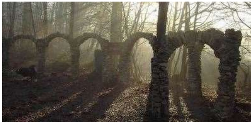
Skulpturenpark in Seckach

Seckach wurde erstmals 788 im Lorscher Codex erwähnt. Während der Zeit der Stammesherzogtümer lag der Ort im Herzogtum Franken. Das Kloster Seligental erwarb den Ort 1236. Nach dessen Auflösung kam Seckach 1568 an Kurmainz. Dort verblieb es, bis es 1803 aufgrund der Säkularisation im Rahmen des Reichsdeputationshauptschlusses an das Fürstentum Leiningen kam. Nach dessen Auflösung durch die Rheinbundakte nur drei Jahre später kam