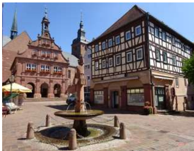
Der historische Marktplatz von Buchen

Wir durchqueren anschließend den Weiler Zittenfelden, überqueren die Landesgrenze nach Baden-Württemberg und erreichen den schmucken Ort Hettigenbeuren, ein Stadtteil von Buchen. In der Ortsmitte inmitten des kleinen Kurparks sehen wir den Götzenturm. Der Turm wurde als Wehr- und Wohnturm im frühen 14. Jahrhundert erbaut. Wir wandern nun immer entlang der Morre, kommen zum Waldschwimmbad von Buchen und befinden uns wenig später in diesem Odenwaldstädtchen am Rande des Baulands. Der Ort wurde erstmals 773 genannt und besitzt einen historischen Stadtkern mit zahlreichen Fachwerkbauten. Um 1170 erstmals im Besitz der Herren von Dürn, die den Ort zur Stadt erhoben. 1309 an den Mainzer Erzbischof verkauft und wegen Beteiligung am Bauernaufstand 1525 verlor die Stadt ihre Selbstverwaltung. 1717 wurde ein Großteil der Stadt durch ein Großfeuer vernichtet.