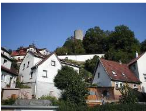
Heriboldisburg oberhalb Herbolzheim

Zuerst steigen wir über die offene Feldflur zum Dürrenberg an. Anschließend geht es durch den Wald am Löchesbrunnen vorbei hinab ins Jagsttal nach Neudenau. Neudenau geht auf einen ursprünglich Busingen genannten Ort zurück, der im frühen 13. Jahrhundert von den Herren von Dürn befestigt wurde. Die Befestigung folgte der Anlage der Burg Wildenberg und steht im Zusammenhang mit dem etwa zur selben Zeit erfolgten Ausbau der Orte Buchen, Forchtenberg und Walldürn. Um 1300 kam die Stadt in den Besitz der Herren von Weinsberg. Im Dreißigjährigen Krieg hatte Neudenau wie fast alle umliegenden Orte unter Einquartierungen, Truppendurchzügen und Seuchen zu leiden. Im Jahre 1803 kam Neudenau in den Besitz der Grafen von Leiningen-Heidesheim und wurde schließlich nach der Auflösung des Römisch-Deutschen