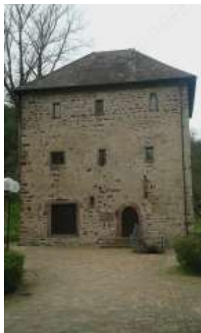
Der Götzenturm in Hettigenbeuren

neben einigen anderen Quellen im Odenwald als der Ort gehandelt, an dem Siegfried im Nibelungenlied von Hagen ermordet wurde.