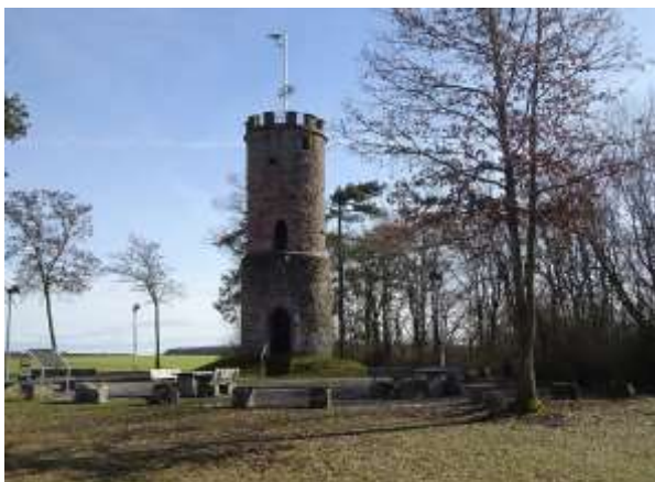
Der Wartturm bei Buchen

Zum Start der Etappe wandern wir an den Stadtrand von Buchen und durch die offene Feldflur erreichen wir