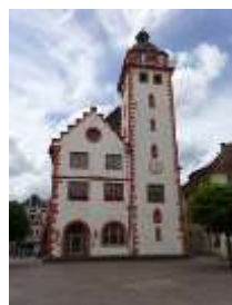
Links: Das Palm'sche Haus Rechts: Das Rathaus

Übersichtskarte: „© OpenStreetMap Mitwirkende“, Text und Bilder: Odenwaldklub e.V