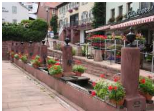
Zwölf-Röhren-Brunnen von Beerfelden

Ortskern angekommen sind. Beerfelden liegt auf der