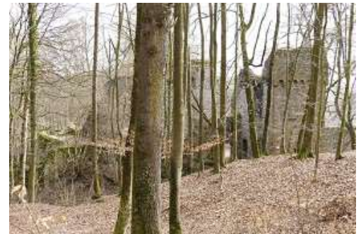
Die Ruine Rodenstein

1962 wurden Erhaltungsarbeiten durch das Hessische Landesdenkmalamt durchgeführt.