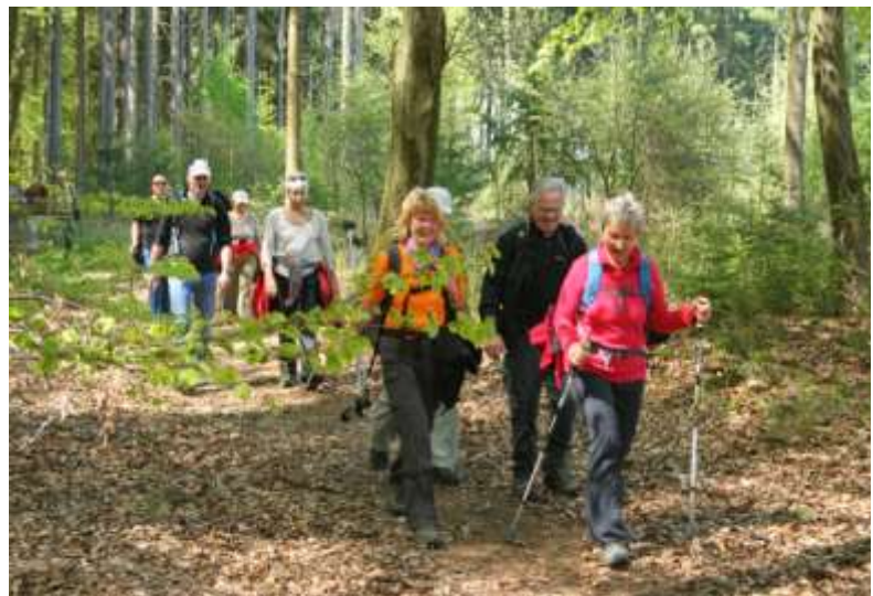
Gemeinsam macht Wandern Spaß

Bild 6: Gemeinsam macht Wandern Spaß- OWK