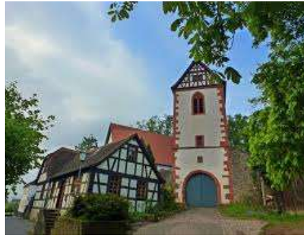
historische Wehrkirche, Wersau