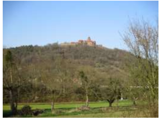
Die Burg Breuberg

Unterwegs hat man einen guten Blick auf die mächtig Burg Breuberg. Neustadt, ein Stadtteil von Breuberg, erhielt durch Kaiser Karl IV. im Jahre 1378 das Marktrecht für Wochenmärkte und die Hochgerichtsbarkeit für diese Märkte verliehen. Das in 1646 errichtete und zuletzt 1949 erneuerte Holzkreuz mit Hand und Schwert gilt als Zeichen des Königsbannes. Die Bürger stellten es in der Zeit des Dreißigjährigen Krieges auf, weil sie Stadt- und Marktrechte nicht verlieren wollten. Die Burg Breuberg liegt im Sandstein-Odenwald und ist aus lokalem Sandstein erbaut.