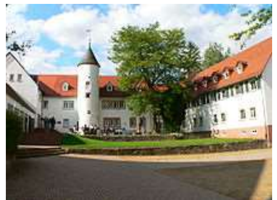
Das Kloster Höchst

Nach dem Überqueren der Kreisstraße K112 geht es bergauf zum Spitzeberg und weiter in südlicher Richtung über den Neueberg und Galgenberg nach Höchst. Höchst wurde erstmals im Jahre 1156 erwähnt und war im Besitz der Herren von Breuberg, den Grafen von Wertheim sowie Erbach und den Herren von Eppstein. Um 1200 gründete die Reichsabtei Fulda in Höchst ein Augustinerinnen-Kloster, das 1506 an Benediktinerinnen übergang und in der Zeit nach der Reformation 1548 aufgehoben wurde. Heute wird das Kloster als Seminarzentrum genutzt.