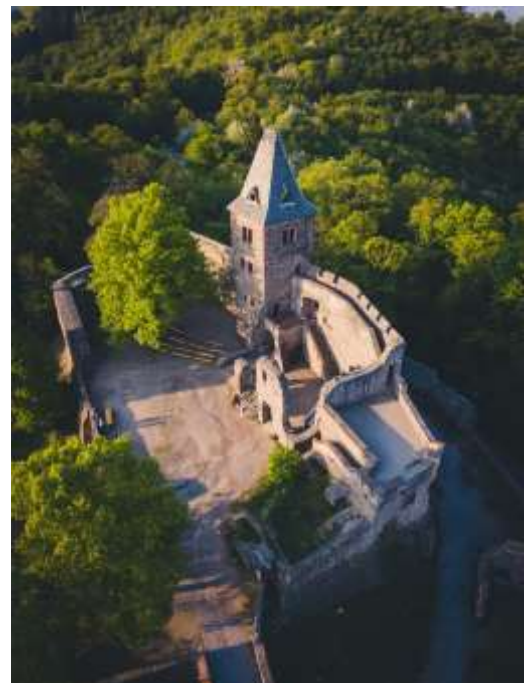
Die Burg Frankenstein

Malchen gehört zur Gemeinde Seeheim-Jugenheim und liegt im südhessischen Landkreis Darmstadt-Dieburg. Urkundlich erstmals in den 1380er Jahren erwähnt, wurde Malchen im Jahre 1420 durch Pfalzgraf Ludwig erworben. Unmittelbar danach ging Malchen in die Grafschaft Erbach und im Jahre 1714 in die Landgrafschaft Hessen-Darmstadt über. Die Kirche wurde 1514 erstmals urkundlich erwähnt. Sie ist seit Mitte des 19. Jhs. mehrfach renoviert worden. Sehenswert sind in diesem Kulturdenkmal gotische Wandmalereien aus dem 15. Jh..