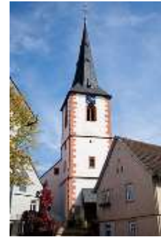
gotische Kirche, Brensbach