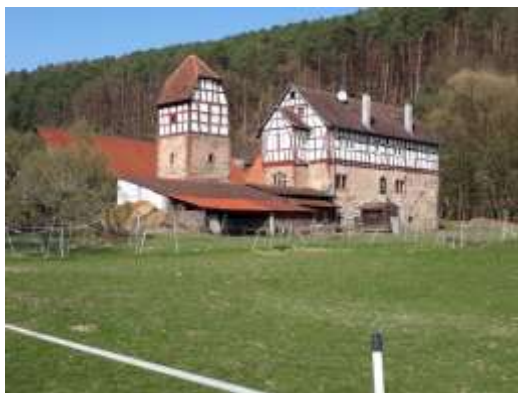
Die alte Wasserburg von Schloß Nauses

Der Wanderweg führt nun stetig bergauf durch Wald bis zur Kammlinie des Böllsteiner Odenwalds, welche vom Morsberg und der Spreng im Süden über die Ortschaften Böllstein und Hassenroth bis zum Vulkankegel des Otzberg reicht, insgesamt 11km. Über diese Kammlinie führt eine historische Altstraße,