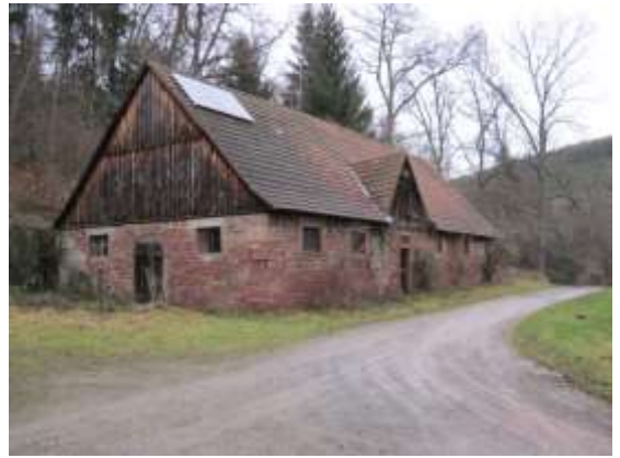
Das verlassende Dorf Galmbach

deshalb wird der Ort auch Schlangennest genannt. Auf der Mudauer Hochebene angekommen, wandern wir auf Forstwegen nach Waldauerbach, weiter durch den kleinen Ort und durch den Wald nach Langenelz. Dann geht es ein kurzes Stück nach Norden auf der Wanderbahn nach Mudau. Das Rathaus, ein spätgotischer Bau wurde 1434 von dem Erzbischof Dietrich, Schenk zu Erbach und dem Kurfürsten von Mainz geschaffen.