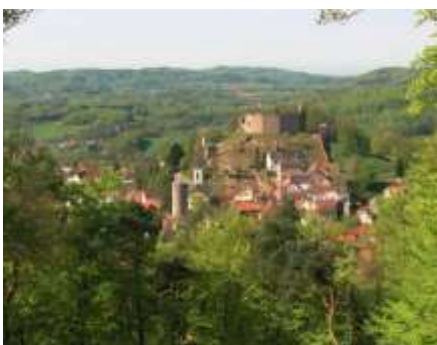
Lindenfels mit Burg

Von Lützelbach führt uns das rote Quadrat weiter in Richtung Neunkirchen. Neunkirchen ist mit 500 m ü.NN der höchstgelegene Ort im hessischen Odenwald. Bei klarem Wetter kann