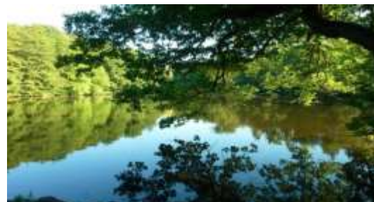
Jakobiweiher an der Oberschweinstiege

Das rote Quadrat weist uns den Weg durch das Villenviertel und den schönen Schrebergärten des Lerchesberges. Hier befinden wir uns am zweithöchsten Punkt der ersten Etappe. Nun geht es im Frankfurter Stadtwald bergab Richtung Oberschweinstiege. Das Waldlokal lädt zur Rast ein.