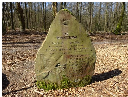
Der Steinwegweiser am Zigeunerstock