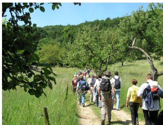
Wandergruppe des OWK

Der Ausgangspunkt unseres Wanderweges ist in der Ortsmitte von Leutershausen neben der Bundesstraße 3 und dem Bahnhof. Die erste urkundliche Erwähnung von Leutershausen findet sich im Lorscher Codex um das Jahr 877. In der Ortsmitte befindet sich auch das Schloss des Grafen von Wiser. Die Fassade ist im oberitalienischen Stil gehalten und das Schloss ist heute immer noch im Besitz der Grafenfamilie. Wir folgen unserer Markierung die Straße aufwärts und kommen an der evangelischen Kirche und dem Friedhof vorbei. Nun geht es an den Weinbergen hinauf zur schön gelegenen Grillhütte ‚Am Kehrang‘ und weiter durch den Wald aufwärts zum Kanzelberg. Nachdem wir das Naturfreundehaus ‚Schriesheimer Hütte‘ der Naturfreunde (am Wochenende geöffnet) passiert haben erreichen wir nach einem kurzen steilen Anstieg die aussichtsreiche Ursenbacher Höhe