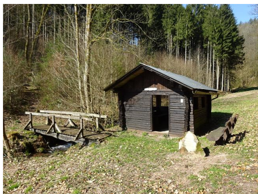
Die Schutzhütte im Rautal