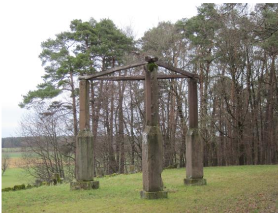
Der Galgen bei Mudau

Am Anfang der Etappe kommen wir zum ehemaligen Galgen der Blutgerichtsbarkeit des Markt Mudau. Auf der Hochebene wandern wir leicht abwärts nach Hollerbach und gehen am idyllischen Hollersee mit Rastplatz vorbei. Auf einem Pfad erreichen wir das Wanderheim des OWK Buchen und befinden uns nach wenigen Minuten am Ende des Bergstraße-Madonnenländchen-Weges in der Ortsmitte von Buchen. Buchen wurde erstmals 773 genannt und besitzt einen historischen Stadtkern mit zahlreichen Fachwerkbauten. Um 1170 erstmals im Besitz der Herren von Dürn, die den Ort zur Stadt erhoben. 1309 an den Mainzer Erzbischof verkauft und wegen Beteiligung am Bauernaufstand 1525 verlor die Stadt ihre Selbstverwaltung. 1717 wurde ein Großteil der Stadt durch ein Großfeuer vernichtet.