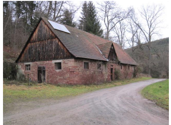
Das verlassende Dorf Galmbach

deshalb wird der Ort auch Schlangennest genannt. Auf der Mudauer Hochebene angekommen, wandern wir auf Forstwegen nach Waldauerbach, weiter durch den kleinen Ort und durch den Wald nach Langenelz. Dann geht es ein kurzes Stück nach Norden auf der Wanderbahn nach Mudau. Das Rathaus, ein spätgotischer Bau wurde 1434 von dem Erzbischof Dietrich, Schenk zu Erbach und dem Kurfürsten von Mainz geschaffen.