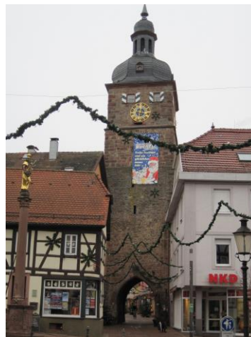
Stadttor von Buchen

Übersichtskarte: „© OpenStreetMap Mitwirkende“, Text und Bilder: Odenwaldklub e.V.