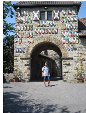
Das Tor zur Wachenburg