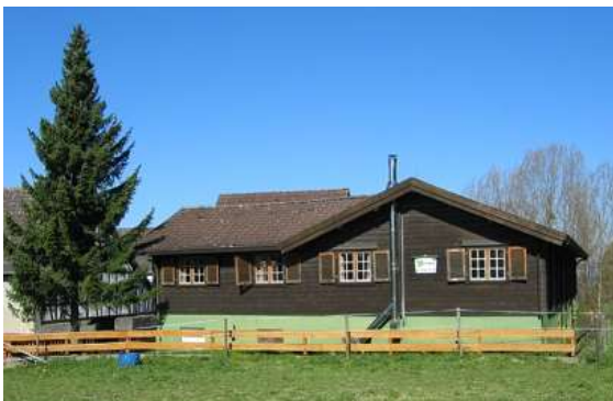
Das Wanderheim des OWK in Knoden

Bensheim liegt am östlichen Rand der Oberrheinischen Tiefebene, direkt an den westlichen Ausläufern des Odenwaldes, an der Bergstraße. Die etwa 40.500 Einwohner zählende Stadt gehört zum Landkreis Bergstraße. Die Stadt wurde erstmals im Jahr 765 im Lorscher Codex erwähnt. An den geschützten Hängen des Odenwaldes — die Hessische Bergstraße gehört zu den wärmsten Regionen Deutschlands — gedeihen hervorragende Weine. Am Bahnhofsvorplatz in Bensheim beginnt unser Wanderweg in Richtung Main. Wir laufen durch die Stadt und am Friedhof biegen wir in den Röderweg ein und über die Feldflur geht es oberhalb von Zell und Gronau stetig hinauf bis wir nach Knoden kommen, einem Ortsteil der Gemeinde Lautertal. Am Wegesrand liegt das Wanderheim des Odenwaldklubs. In dem Selbstversorgerhaus können insgesamt 36 Personen übernachten. Die Markierung bringt uns bergab nach Kolmbach und beim nächsten Aufstieg und im Bergsattel haben wir herrliche Ausblicke über die Hügellandschaft des Odenwaldes. Nun wandern wir nach Winterkasten zum Ende unserer ersten Etappe.