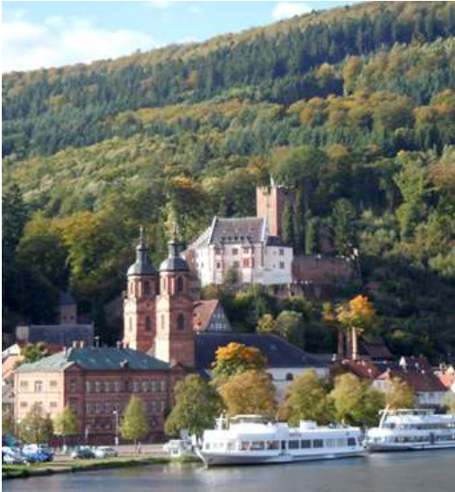
Miltenberg, im Hintergrund die Mildenburg

dem Marktbrunnen von 1583 und der früheren Amtskellerei, in der ein sehenswertes Heimatmuseum untergebracht ist. In der Hauptstraße sehen wir neben vielen Fachwerkhäusern das älteste Gasthaus Deutschlands, den „Riesen“, in ihm haben bereits Martin Luther und der kaiserliche Feldherr im Dreißig-jährigen Krieg, Tilly übernachtet.