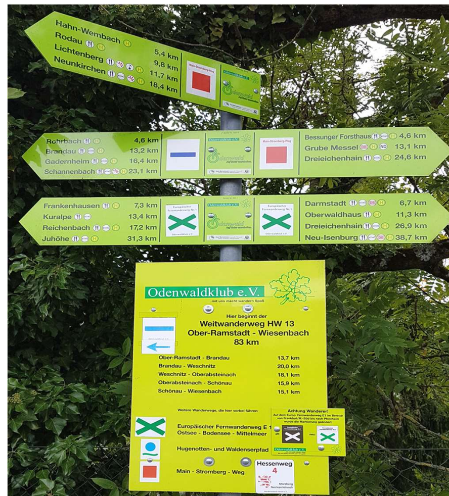
OWK-Wegemarkierung in Ober-Ramstadt am Bahnhof