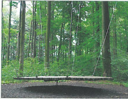
Waldthemenpfad: „Blatt im Wind“