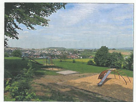
Blick auf Ober-Ramstadt