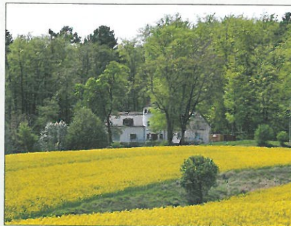
Naturfreundehaus „Am Heidenacker“