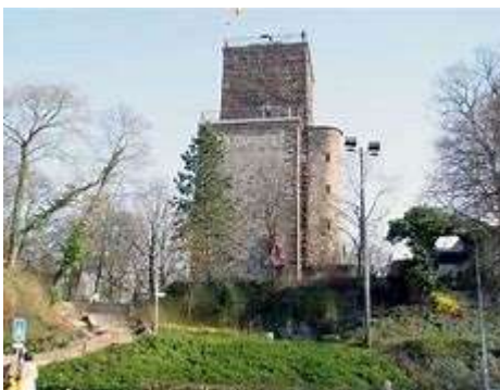
Der Turmberg

1. Etappe: Karlsruhe-Durlach – Bretten 22,8 km