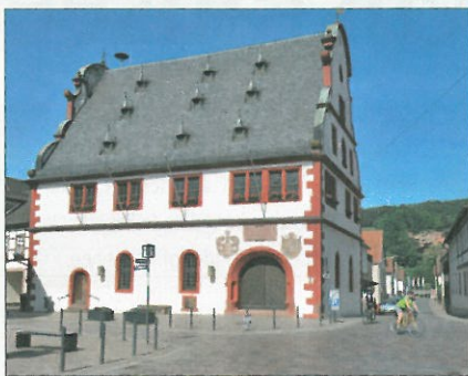
Das alte Rathaus in Bürgstadt