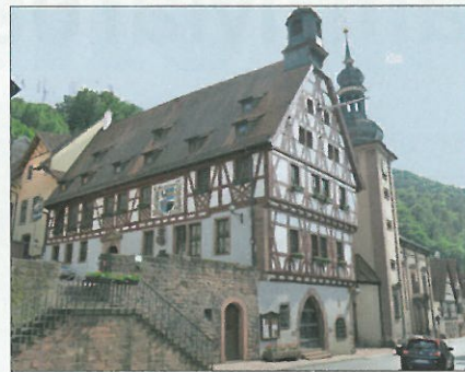
Rathaus und Kirche in Freudenberg