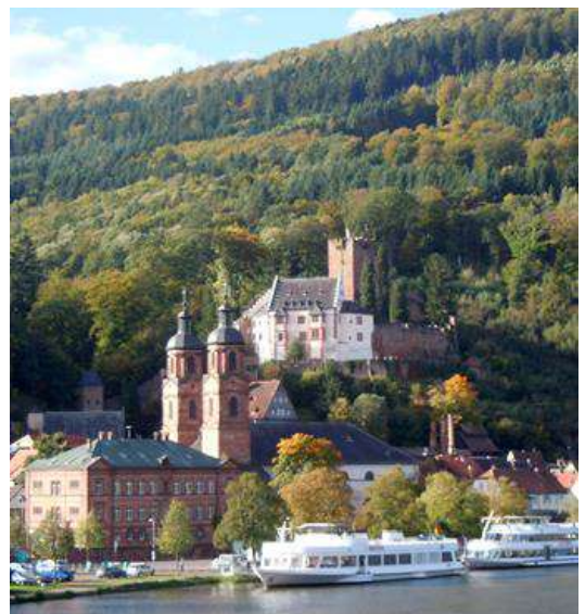
Miltenberg, im Hintergrund die Mildenburg

Miltenberg am Main liegt zwischen Odenwald und Spessart und ist bekannt durch seinen von mittelalterlichen Fachwerkhäusern umsäumten Marktplatz, das „Schnatterloch“ und das Hotel „Zum Riesen“ aus dem Jahr 1590, der ältesten Fürstenherberge Deutschlands. Von der über der Altstadt gelegenen Mildenburg hat man eine herrliche Aussicht auf die Dächer der Stadt, den Odenwald, den Spessart und das Maintal. An der Mündung der Mud (Mudau) in den Main hatten die Römer ein Kastell. Hier traf der aus dem Odenwald kommende Limes auf den Main.