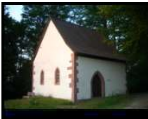
Die St. Wendelin-Kapelle

Auf dieser kurzen Etappe können wir uns Zeit lassen und einige Sehenswürdigkeiten bewundern. Ostheim, seit dem 17. Jahrhundert Großostheim genannt, wird erstmals in einer Urkunde des Klosters Fulda erwähnt, die zwischen 780 und 799 entstand. Ostheim gehörte seit seiner ersten urkundlichen Erwähnung