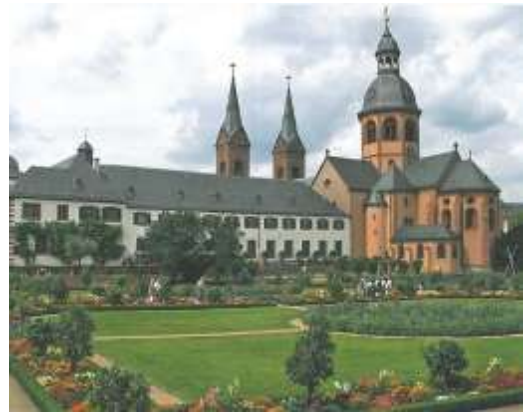
Die Seligenstädter Basilika

Ausgangspunkt unserer Wanderung ist die schmucke Fachwerkstadt Seligenstadt. Schon zur römischen Zeit stand hier ein großes Kastell, an dessen Stelle in fränkischer Zeit der königliche Meierhof Obermühlheim stand. Einhard, der Sekretär und Biograph Karls des Großen, brachte die Gebeine der im Jahre 304 in Rom gestorbenen Märtyrer Petrus und Marzellius von Steinbach bei Michelstadt nach Obermühlheim. Ihnen zu Ehren baute er eine große Basilika. Der Baubeginn war in den Jahren 831 -834. Die Basilika wurde im 13., 18. und 19. Jh. umgebaut. 1953 wurde das ursprüngliche Bauwerk wieder hergestellt. Das „Rote Schloss“ ist ein Überrest des staufischen Kaiserpalastes von 1240. Reste der alten Stadtbefestigung sind noch vorhanden. 1501-1525 war der Maler Matthias Grünewald Bürger von Seligenstadt.