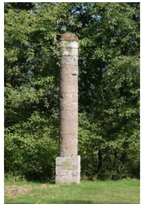
Überreste des ehem. Galgen

Laudenbach wurde erstmals 1248 urkundlich erwähnt. Götz von Fechenbach kaufte 1315 von Grafen Heinrich von Rieneck das Dorf als Lehen des Erzbischofs von Mainz, der Landesherr bis 1803 war. Das Geschlecht der Fechenbachs starb 1951 aus. Das jetzige Schloss wurde um 1725 erbaut und befindet sich im Besitz der Familie des verst. Freiherrn von Aufseß. Die um 1700 gebaute Barockkirche, von der der Turm stehen blieb, wurde 1960 durch einen Neubau ersetzt. Erhalten darin die Rokokokanzel (um 1768).