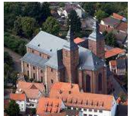
Die Basilika von Walldürn

Wir passieren die Laurentiuskapelle, kommen an einem alten Galgen vorbei und gelangen hinunter nach Walldürn, in der Nähe des Bahnhofs.