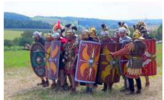
Aufmarsch der Römer

Vorbei am gut erkennbaren Wachtposten Wp. 8/25 „Am Bangholz“ folgen wir dem Limes- Wanderweg weiter durch Felder hinab nach Osterburken zum Bahnhof.