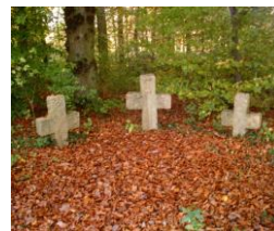
Abbildung 3+4: Am E1 und HW46