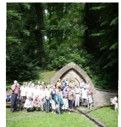
Die Drei Kreuze und Siegfriedsbrunnen bei Östringen