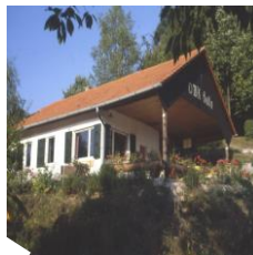
Abbildung 2: OWK Hütte Münzesheim