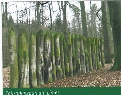
Palisadenzaun am Limes