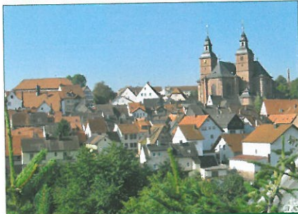
Blick auf Walldürn