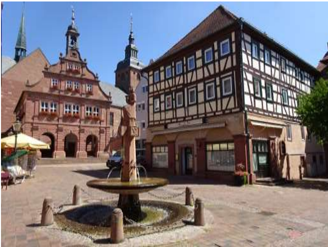
Der historische Marktplatz von Buchen ein Großteil der Stadt durch ein Großfeuer vernichtet.

Wir durchqueren anschließend den Weiler Zittenfelden, überqueren die Landesgrenze nach Baden-Württemberg und erreichen den Ort Hettigenbeuren, ein Stadtteil von Buchen. Wir wandern nun immer entlang der Morre, kommen zum Waldschwimmbad von Buchen und befinden uns wenig später in diesem Odenwaldstädtchen am Rande des Baulands. Der Ort wurde erstmals 773 genannt und besitzt einen historischen Stadtkern mit zahlreichen Fachwerkbauten. Um 1170 erstmals im Besitz der Herren von Dürn, die den Ort zur Stadt erhoben. 1309 an den Mainzer Erzbischof verkauft und wegen Beteiligung am Bauernaufstand 1525 verlor die Stadt ihre Selbstverwaltung. 1717 wurde