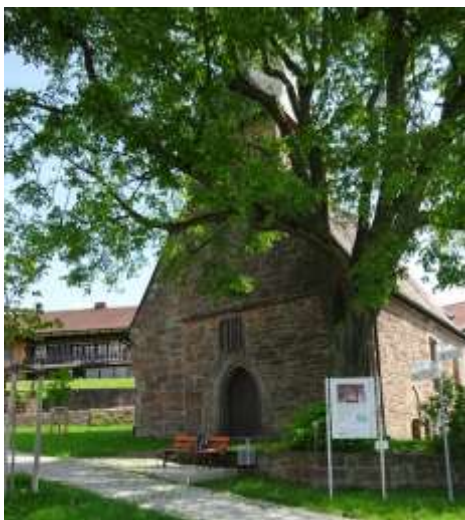
St. Martins- und Veitkappelle von Steinbach

Von Amorbach starten wir die Etappe mit einem Anstieg durch den Wald auf den Beuchner Berg und später durch die offene Feldflur nach Beuchen, wo wir auf den Qualitätswanderweg Nibelungensteig treffen.