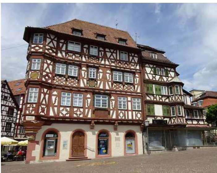
Das Palm'sche Haus