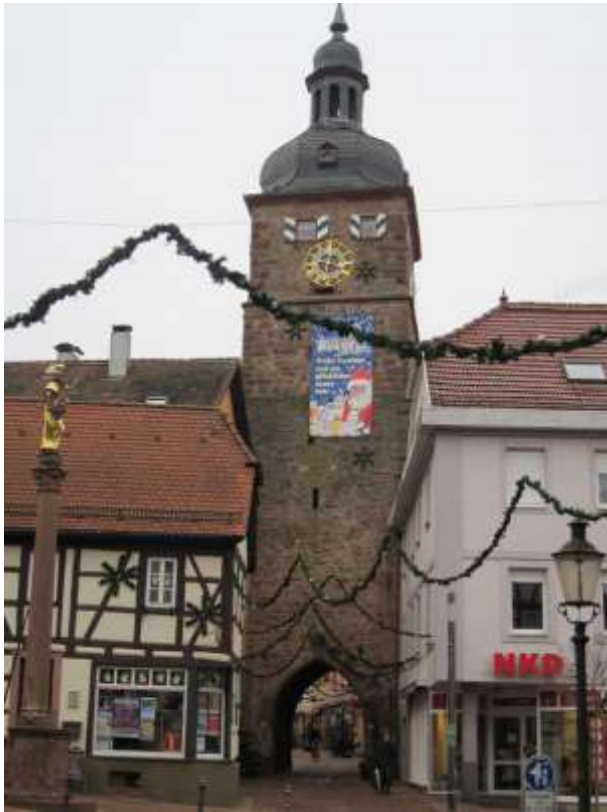
Das Stadttor zu Buchen

dem südöstlichen Odenwald und dem Bauland. Der Ort wurde erstmals 773 genannt und besitzt einen historischen Stadtkern mit zahlreichen Fachwerkbauten. Um 1170 erstmals im Besitz der Herren von Dürn, die den Ort zur Stadt erhoben. 1309 an den Mainzer Erzbischof verkauft und wegen Beteiligung am Bauernaufstand 1525 verlor die Stadt ihre Selbstverwaltung. 1717 wurde ein Großteil der Stadt durch ein Großfeuer vernichtet.