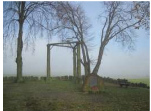
Der Beerfelder Galgen

zusammengeschlossen haben. Airlenbach ist bekannt für seine ca. 800 Jahre alte Dicke Eiche am Ortseingang, von der leider durch Krankheit nur noch der Baumstumpf vorhanden ist. Wir steigen durch den Wald auf und erblicken auf der Höhe den Beerfelder Galgen, der 1597 errichtet wurde. Drei etwa 5 m hohe schlanke Rotsandsteinsäulen bilden ein Dreieck, das oben miteisenbewehrten Balken verbunden ist. Hier wurden bis 1804 die Todesurteile der Oberzent Beerfelden vollstreckt. Der Galgen in Beerfelden ist der größte und am besten erhaltene Galgen in Deutschland. Nun ist es nicht mehr weit zum Etappenende nach Beerfelden. Der staatlich anerkannte Erholungsort Beerfelden wurde erstmals 1032 unter dem Namen „Burrifelden“ im Lorscher Kodex erwähnt. Kaiser Ludwig der Bayer hat Beerfelden bereits im Juni 1328 die Stadtrechte verliehen. Der „Beerfelder Pferde-, Fohlen-, und Viehmarkt“ findet seit über 100 Jahren immer am 2. Wochenende im Juli statt. Der traditionelle Viehmarkt am Montag ist die größte Zuchtviehschau Hessens. In der Ortsmitte entdecken wir eine der Sehenswürdigkeiten der Stadt, die im „Zwölf-Röhren-Brunnen“ gefasste Mümlingquelle. Auf einer langen Sandsteinwanne stehen sieben Sandsteinsäulen und aus zwölf gegossenen Löwenköpfen fließt das Quellwasser der Mümling. Der mit Blumen geschmückte Brunnen zählt zu den schönsten Laufbrunnen Deutschlands.