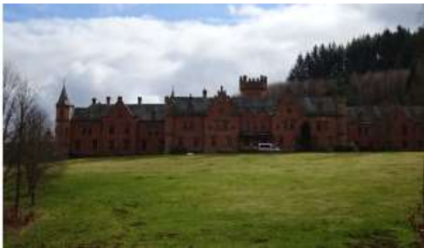
Das Schloß Waldleiningen

Schöllnbach. Schon die ersten Siedler im frühen Mittelalter errichteten hier eine Kapelle, die sich zu einem Wallfahrtsort entwickelte, da dem Quellwasser heilende Wirkung zugesprochen wurde. Im Jahre 1465 wurde das Kirchlein durch eine dreischiffige gotische Wallfahrtskapelle von Schenk Philipp |V. von Erbach ersetzt. Nach Einführung der Reformation geriet die Kirche in Vergessenheit und zerfiel. Erst 1780 wurde aus den Ruinen die neue, heutige Kirche gebaut. An der südlichen Mauer tritt noch heute das Quellwasser zu Tage und fließt gleich nebenan in den Itterbach. Mit dem Bergstraße-Bauland-Weg geht es auf einem naturnahen Pfad in Serpentinaen hinauf nach Hesselbach. Mitte des 11. Jahrhunderts konnte das Kloster Amorbach den Wildbann östlich vom Euter- und Itterbach vom Bistum Worms erwerben. Dies war jedoch nicht der Beginn einer Besiedelung in Hesselbach. Urkundlich wurde der Ort erstmals 1334 genannt. Sehenswert ist noch die katholische Pfarrkirche St. Luzia und St. Odilia mit ihrem prächtigen Altar. Am Waldrand treffen wir auf den Östlichen Limesweg und den Qualitätsweg „Nibelungensteig“, der von Zwingenberg an der Bergstraße bis nach Freudenberg am Main geht. Wir folgen dem Nibelungensteig einen Pfad abwärts, halten uns dann links und laufen einen Forstweg ca. 20 Minuten bis wir zu einer großen Wegspinne kommen. Hier verlassen wir nach rechts den Nibelungensteig und erblicken vom Waldrand aus das romantische Schloss Waldleiningen.