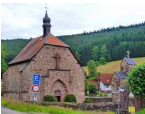
Die Quellkirche von Schöllnbach