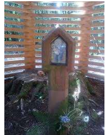
Das Bullauer Bild