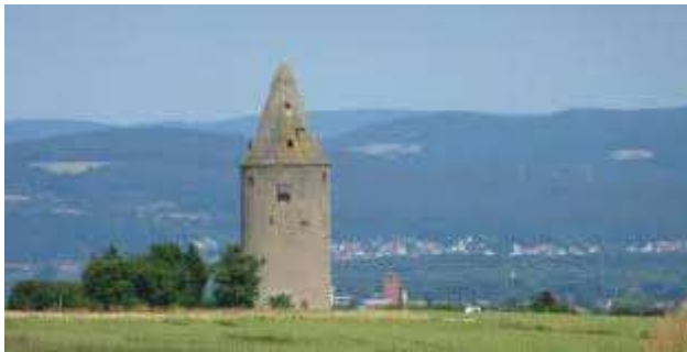
Der Bachgauer Wartturm

Der Bachgau-Kraichgau-Weg führt uns an Streuobstwiesen und Felder entlang zum sehenswerten Wartturm mit einem herrlichen Rundblick über den Bachgau und den Spessart. Oberhalb von Radheim steht der 1492 gebaute Wartturm. Dieser wurde vom Mainzer Erzbischof Graf Berthold von Henneberg zur Sicherung der Mainzer Landwehr, in Auftrag gegeben. Die Markierung führt uns zuerst auf der Höhe entlang durch die