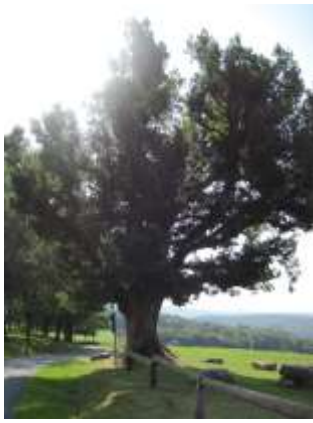
Die Momarter Eiche