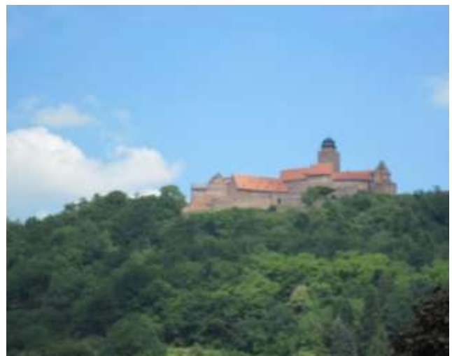
Die Burg Breuberg

Höhe an Feldern und Weidewiesen vorbei hinab ins Mümlingtal nach Bad König. Bad König war bis 1806 Regierungssitz der Grafschaft Erbach-Schönberg mit einem Schloss der Fürsten Erbach-Schönberg. Um 1900 wurden zwei kohlensaure Eisenquellen entdeckt, später weitere sechs Quellen, die den Anfang zur Entwicklung zu einem bedeutenden Kurzentrum mit Thermal- Bewegungsbad bildeten.