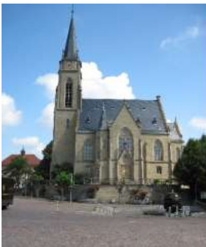
Kirche von Bad Rappena