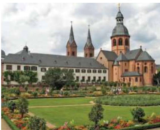
Die Seligenstädter Basilika mit Klostergarten

Karls des Großen – brachte die Gebeine der 304 in Rom gestorbenen Märtyrer Petrus und Marzellius von Steinbach bei Michelstadt nach Obermühlheim. Ihnen zu Ehren baute er eine große Basilika. Der Baubeginn war in den Jahren 831-834. Die Basilika wurde im 13., 18. und 19. Jh. umgebaut. 1953 wurde das ursprüngliche Bauwerk wiederhergestellt. Das „Rote Schloss“ ist ein