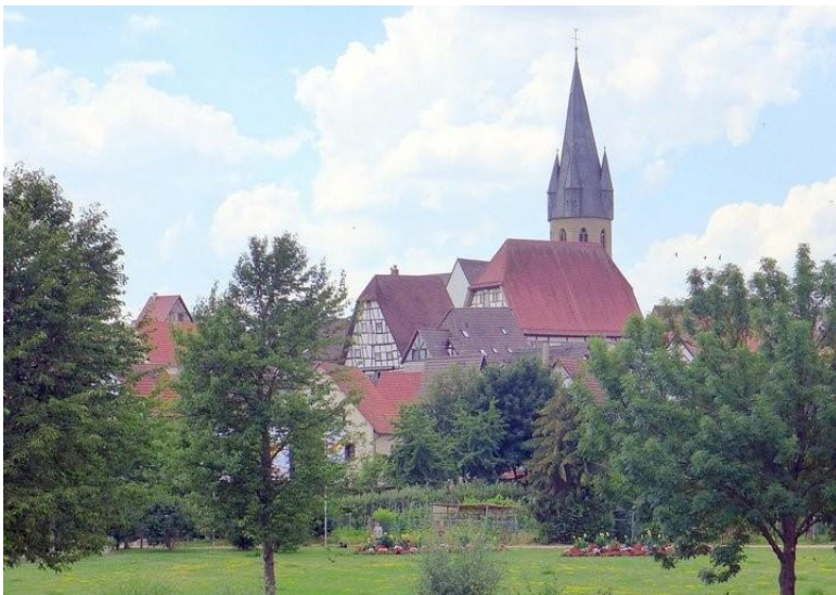
Eppingen vom Hessen-Kraichgau-Weg