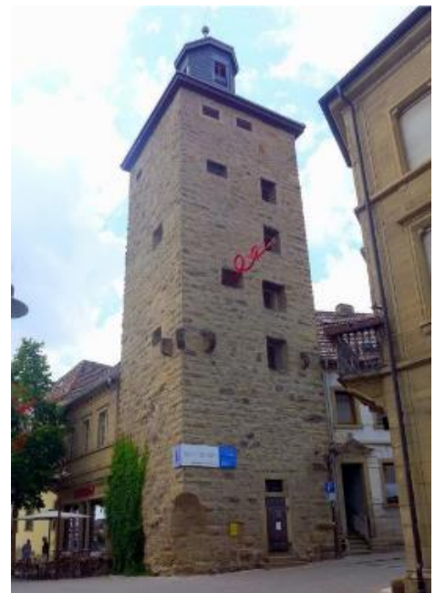
Pfeiferturm von Eppingen

Übersichtskarte: „© OpenStreetMap Mitwirkende“, Text und Bilder: Odenwaldklub e.V