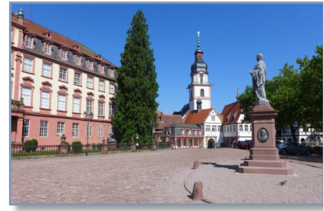
Das Erbacher Schloss

Dort empfängt uns das beeindruckende Schloß mit dem Deutschen Elfenbeinmuseum. Auf 450 Quadratmetern lassen sich filigrane Elfenbeinfiguren bestaunen, die von der vielfältigen Odenwälder Schnitzkunst zeugen. Ein 90 Meter langer, beleuchteter Steg führt durch die Räume und an die klimatisierten Spezialvitrinen heran. In der Werkstatt des Museums werden Techniken, Werkzeuge und Materialien der Elfenbeinschnitzkunst anschaulich erläutert. Der Name Erbach wurde von „Erbach“ abgeleitet. Das ursprünglich um Dorf-Erbach ansässige Adelsgeschlecht der Herrn von Erbach baute