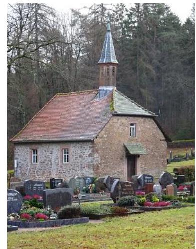
Kirche auf dem Sensbacher Friedhof

Zum Anfang erwartet uns ein steiler Anstieg zum Krähberg. Am Reußenkreuz treffen wir auf den Bachgau-Kraichgau-Weg des OWK und wandern auf dem Höhenrücken, erst auf breitem Forstweg, dann auf einem naturnahen Waldweg zum Sensbacher Friedhof. Der Friedhof wurde 1619 angelegt und diente dem gesamten Sensbachtal. 1744 wurde auf dem Friedhof die heute unter Denkmalschutz stehende Kapelle errichtet. Auf dem Friedhof befindet sich die Familiengruft der Grafen zu Erbach-Fürstenau. Wir bleiben auf der Sensbacher Höhe und unsere Markierung des Hessen-Kraichgau-Weges führt uns in leichtem Auf und Ab nach Süden. Dann ist noch ein kurzer und steiler Abstieg ins Neckartal zu meistern, bevor wir die Stauferstadt Eberbach am Neckar erreichen. Die Gegend um Eberbach kam schon im frühen Mittelalter durch Schenkung an das Bistum Worms. Erste urkundliche Erwähnung 1012, um 1227 Stadtrechte, 1330 von Kaiser Ludwig dem Bayern an die Pfalzgrafen verpfändet, war die Stadt bis 1801 kurpfälzisch. 1803 fiel sie an das Fürstentum Leinigen, seit 1806 gehörte die Stadt zu Baden. Reste der Stadtmauer mit Türmen sind noch erhalten. Zunächst lohnt sicherlich ein Rundgang durch die Stadt Eberbach; auch eine Schiffs-Rundfahrt auf dem Neckar ist eine interessante Abwechslung und zeigt die Reize der Landschaft aus der Fluss-Perspektive. Wer sich für Land und Leute mehr interessiert; das Museum des Naturparks Neckartal-Odenwald, vermittelt Wissenswertes zur Region auf vielfältige und sehr interessante Weise.