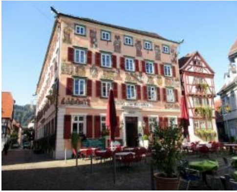
Am Alten Markt in Eberbach

Die Markierung führt uns aus Eberbach über den Neckar in den Ortsteil Neckarwimmersbach und in Serpentinauf zum Aberg auf 460m ü. NN. Gleich darauf kommen wir zum Heiligkreuzkirchlein, eine ehemalige Wallfahrtskapelle mit spätgotischem Fensterwerk. Erbaut wurde das „Kirchel“ 1516 auf den Fundamenten einer noch älteren Kapelle. Durch den Wald erreichen wir auf der Höhe Neunkirchen im Kleinen Odenwald. Die Dörfer Neunkirchen und Neckarkatzenbach entstanden als Rodungssiedlungen des Bistums Worms ab dem 11. Jahrhundert. Während Neckarkatzenbach bereits 1080 erstmals urkundlich erwähnt wird, lässt sich Neunkirchen erst mit der Erwähnung seiner Kirche 1298 historisch greifen. Im 13. Jahrhundert gehörten beide Ortschaften und die benachbarten Burgen zum Reichsbesitz um Wimpfen. Nach dem Ende der staufischen