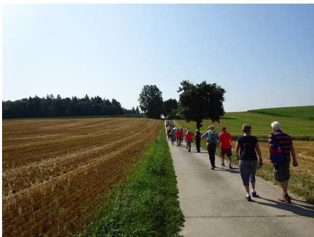
Wandergruppe im Kraichgauer Hügelland

Nach dem Start durchqueren wir den Ort und wandern über den Aglasterhausener Weg und durch die Feldflur zum Naturschutzgebiet Hinterer See. Der Rittersbach bringt uns nach Aglasterhausen. Dieser Ort im Neckar-Odenwald-Kreis wird bereits im Jahre 1143 in einer Urkunde des Bischofs Burkhard zu Worms erwähnt, in der dieser die Vertauschung eines dem Stift Odenheim gehörigen Waldes bei Mühlhausen gegen ein Gut in Aglasterhausen genehmigt. Im Jahre 1862 erhielt Aglasterhausen Anschluss an die Badische Odenwaldbahn; in der Folge soll der Ort wie ausgestorben gewirkt haben. Bäckereien, Gaststätten und