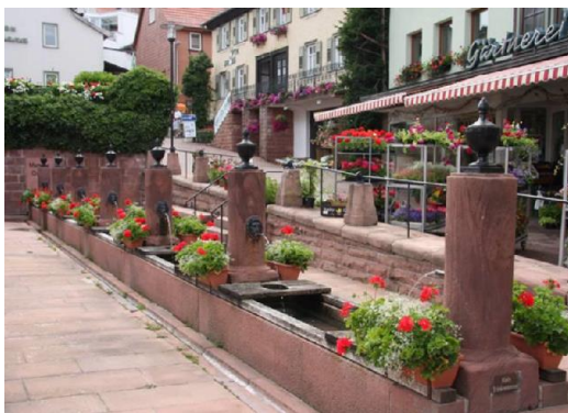
Zwölf-Röhren-Brunnen von Beerfelden

Trotzdem sind es noch gut zwei Kilometer bis wir im Ortskern angekommen sind. Beerfelden liegt auf der Wasserscheide zwischen Main und Neckar an der Quelle der Mümling. Der staatlich anerkannte Erholungsort wurde erstmals 1032 unter dem Namen „Burrifelden“ im Lorscher Kodex erwähnt. Kaiser Ludwig der Bayer hat Beerfelden bereits im Juni 1328 die Stadtrechte verliehen. Der „Beerfelder Pferde-, Fohlen-, und Viehmarkt“ findet seit über 100 Jahren immer am 2. Wochenende im Juli statt. Der traditionelle Viehmarkt am Montag ist die größte Zuchtviehschau Hessens. Oberhalb der Stadt, an der Straße zum Beerfelder Stadtteil Airlenbach, steht auf dem Galgenberg der 1597 errichtete Galgen. Hier wurden bis 1804 die Todesurteile der Oberzent Beerfelden vollstreckt.