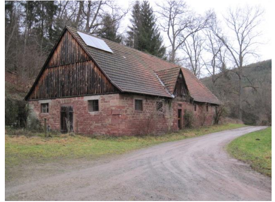
Das verlassende Dorf Galmbach

deshalb wird der Ort auch Schlangennest genannt. Auf der Mudauer Hochebene angekommen, wandern wir auf Forstwegen nach Waldauerbach, weiter durch den kleinen Ort und durch den Wald nach Langenelz. Dann geht es ein kurzes Stück nach Norden auf der Wanderbahn nach Mudau. Das Rathaus, ein spätgotischer Bau wurde 1434 von dem Erzbischof Dietrich, Schenk zu Erbach und dem Kurfürsten von Mainz geschaffen.