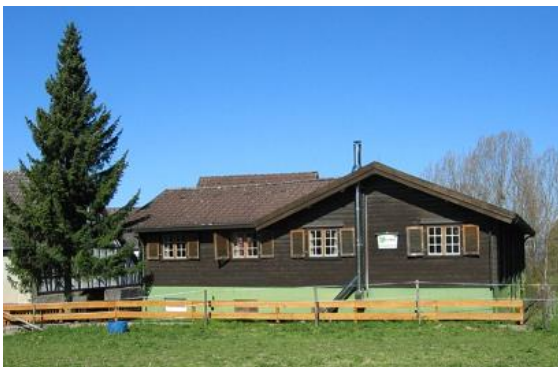
Das Wanderheim des OWK in Knoden

Bensheim liegt am östlichen Rand der Oberrheinischen Tiefebene, direkt an den westlichen Ausläufern des Odenwaldes, an der Bergstraße. Die etwa 40.500 Einwohner zählende Stadt gehört zum Landkreis Bergstraße. Die Stadt wurde erstmals im Jahr 765 im Lorscher Codex erwähnt. An den geschützten Hängen des Odenwaldes — die Hessische Bergstraße gehört zu den wärmsten Regionen Deutschlands — gedeihen hervorragende Weine. Am Bahnhofsvorplatz in Bensheim beginnt unser Wanderweg in Richtung Main. Wir laufen durch die Stadt und am Friedhof biegen wir in den Röderweg ein und über die Feldflur geht es oberhalb von Zell und Gronau stetig hinauf bis wir nach Knoden kommen, einem Ortsteil der Gemeinde Lautertal. Am Wegesrand liegt das Wanderheim des Odenwaldklubs. In dem Selbstversorgerhaus können insgesamt 36 Personen übernachten. Die Markierung bringt uns bergab nach Kolmbach und beim nächsten Aufstieg und im Bergsattel haben wir herrliche Ausblicke über die Hügellandschaft des Odenwaldes. Nun wandern wir nach Winterkasten zum Ende unserer ersten Etappe.