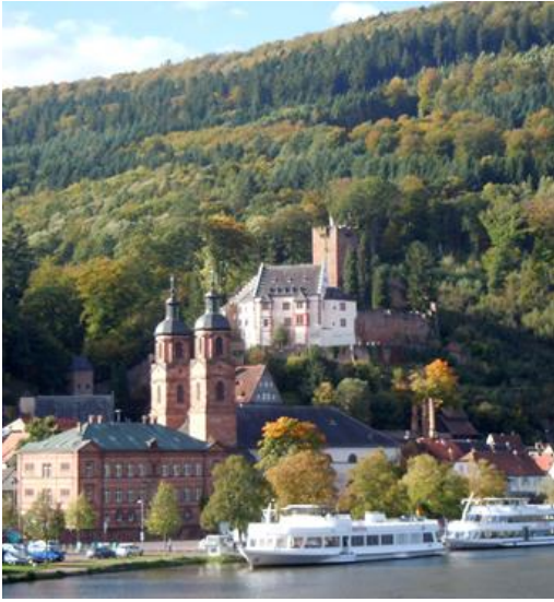
Miltenberg, im Hintergrund die Miltenburg

dem Marktbrunnen von 1583 und der früheren Amtskellerei, in der ein sehenswertes Heimatmuseum untergebracht ist. In der Hauptstraße sehen wir neben vielen Fachwerkhäusern das älteste Gasthaus Deutschlands, den „Riesen“, in ihm haben bereits Martin Luther und der kaiserliche Feldherr im Dreißig-jährigen Krieg, Tilly übernachtet.