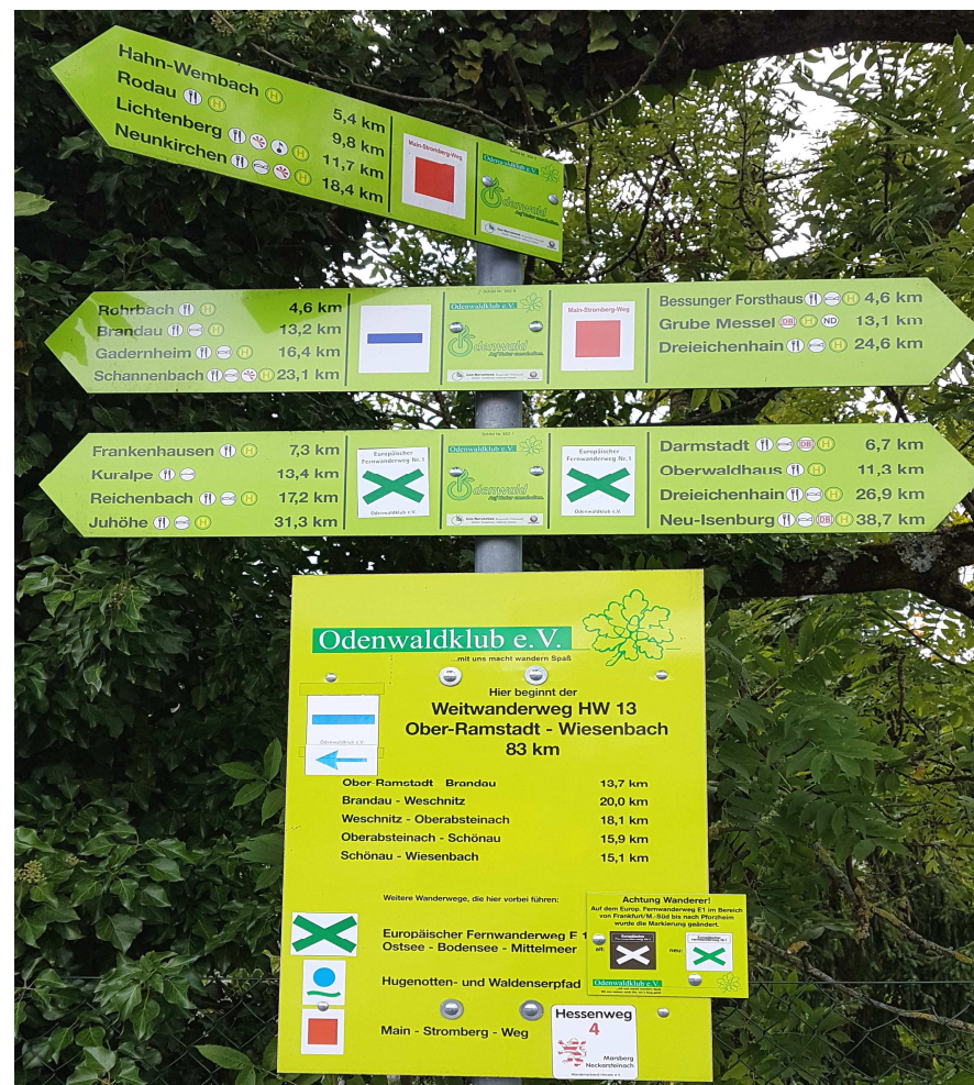
OWK-Wegemarkierung in Ober-Ramstadt am Bahnhof