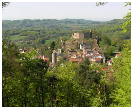
Lindenfels mit Burg

Deshalb gehen wir nun auch zunächst einmal wieder etwas bergab, kommen bald nach Winterkasten, wandern weiter durch landwirtschaftlich genutzte Flächen mit teils schönen Fernsichten, bis wir vorbei an der besteigbaren Bismarckwarte nach knapp 2 Stunden ab Kaiserturm in den Kurort Lindenfels kommen ( www.lindenfels.info ). Hier wandern wir auch ein Teilstück parallel mit dem Nibelungensteig, einem vom OWK betreuten Qualitätswanderweg „wanderbares Deutschland“, der den Odenwald von West nach Ost durchquert ( www.nibelungensteig.info ).