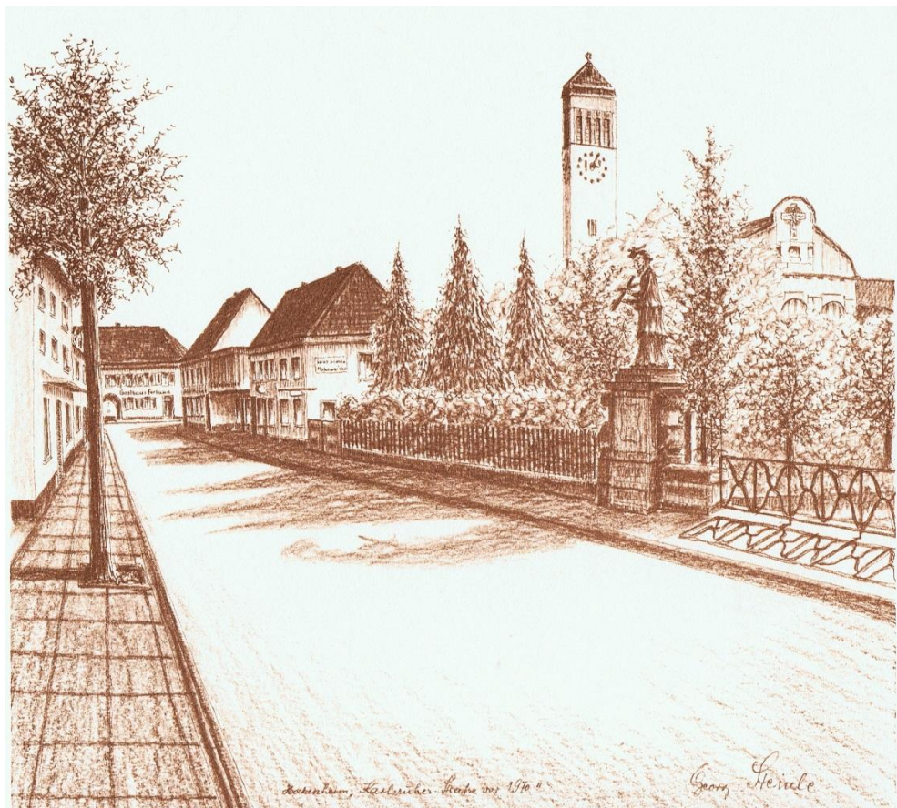
Karlsruherstrasse "Fortuna Blick"