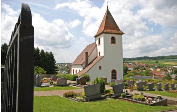
Ev. Kirche in Haag