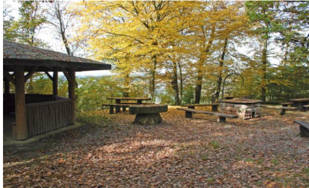
Grafenweg-Hütte bei Bargen