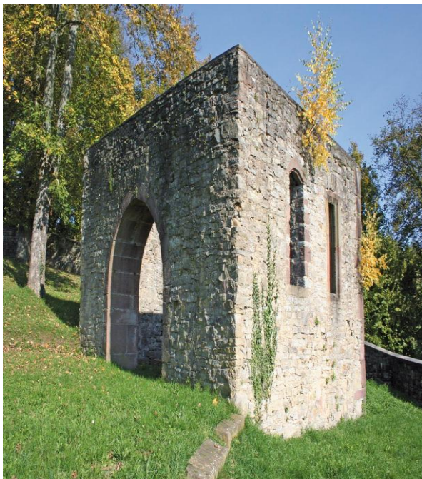
Ruine der Martinskirche bei Meckenheim