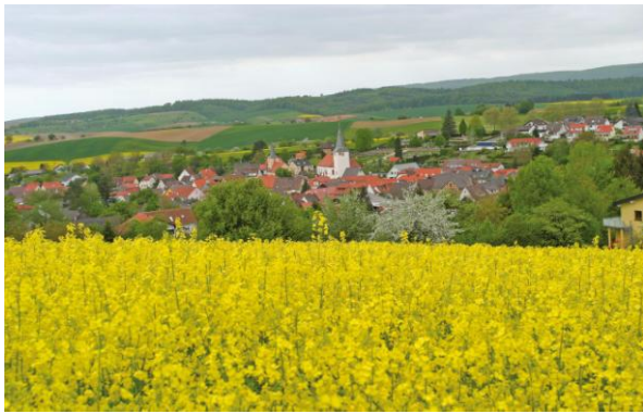
Blick auf Spechbach