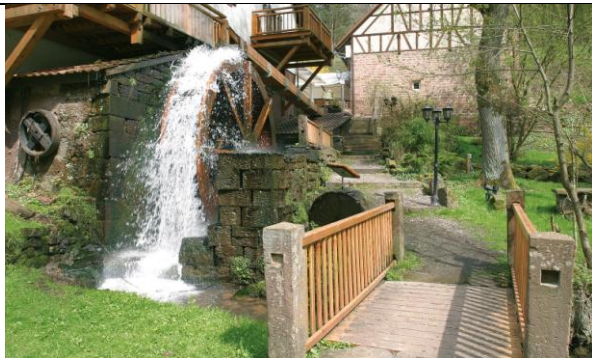
Heidersbacher Mühle