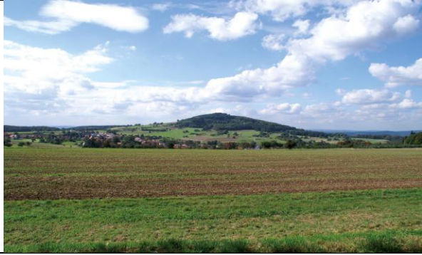
Blick auf den Katzenbuckel